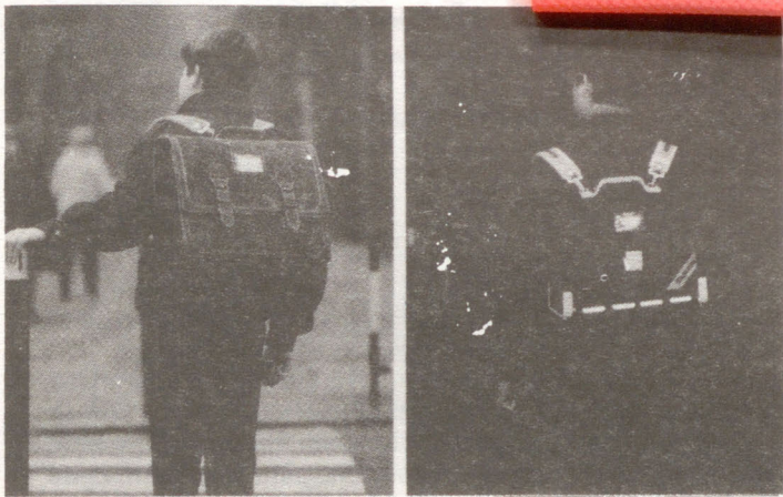
Éléments réfléchissants apposés sur les cartables de la ligne « ANTHÉTIQUE » DE TANN'S

A la prochaine rentrée scolaire, en septembre 1990, les Ministres de l'Éducation Nationale et des Transports lanceront une campagne de sécurité routière dans les écoles primaires : « découvrons ensemble le chemin de l'école ». Une circulaire officielle présentant cette opération paraîtra en mai 1990. Cette campagne sera lancée au cours de la semaine du 1 er au 6 octobre 1990.