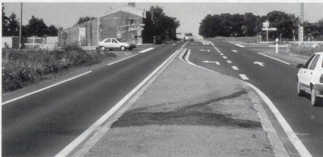
Carrefour de la Bernardière (Vendée) : cinq tués dont quatre enfants - juin 2000

En conclusion , lors des réaménagements de carrefours, la sécurité doit primer sur la fluidité de la voie principale, ce qui conduit à adopter la solution de carrefour giratoire, et à exclure le type carrefour "tourne à gauche central".